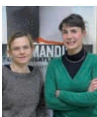
Association French Lines

Parce qu'il participe de l'évolution de l'Histoire maritime. Cet outil de l'économie-monde n'est, certes pas encore, un champ d'étude archéologique direct mais il nous semblait intéressant d'accompagner la réflexion du Port-Musée à ce sujet, d'autant que le surdimensionnement des infrastructures, induit par la conteneurisation, impacte de plus en plus notre activité.